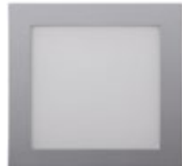
04 Aluminio / Aluminium / Aluminium