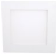
90 Blanco Técnico / Technical White / Blanc Technique